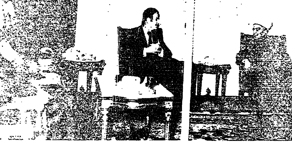
الرئيس الأسد سجدت إلى الشيخ: بعد الحظف تاسم - ويبدو إلى اليسار من العلماء